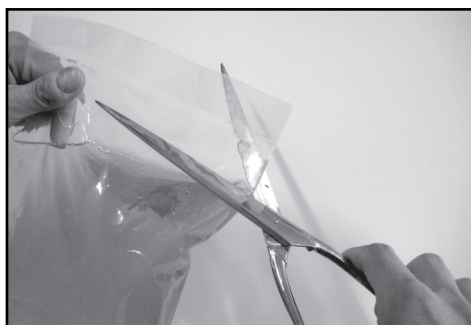
5. Odstřihněte sáček s pryskyřicí