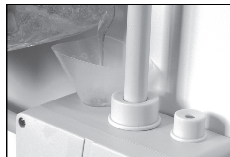
6. Vlijte do krabice