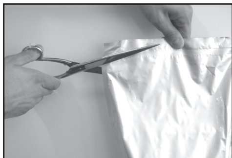
1. Odstraňte ochrannou fólii