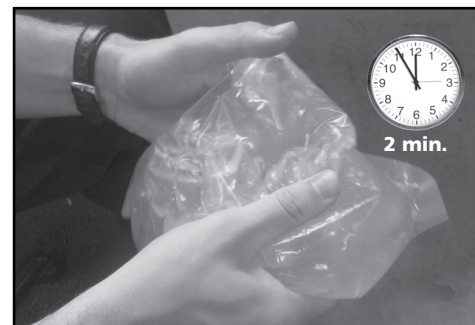
3. Promíchejte obě složky