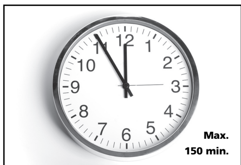
7. Doba tvrdnutí směsi

Prázdné obaly je možno vyhodit do běžného odpadu.